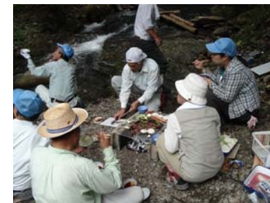
最近、お昼は何か作っています。