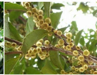
5. ヒサカキ (2月)