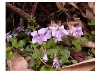
9. タチボスミレ (2月)