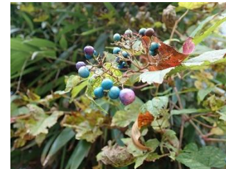
7. ノドウ (10月)