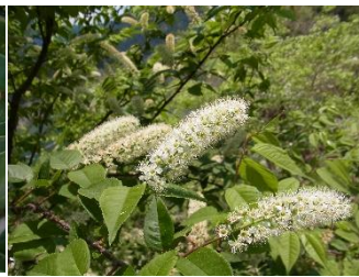
3. ウワミズザクラ (4月)