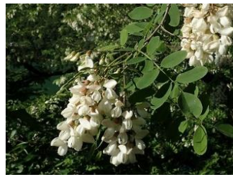
1. ハリエンジュ (5月)