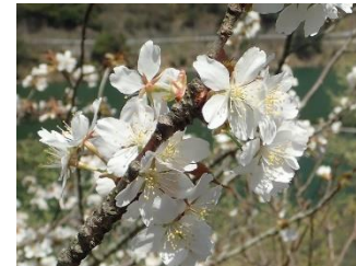
8. カスミザクラ (4月中旬)