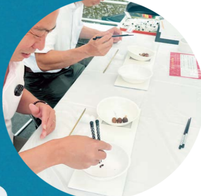
今と昔の箸を使ってみた。器用な人はどっちも得意!