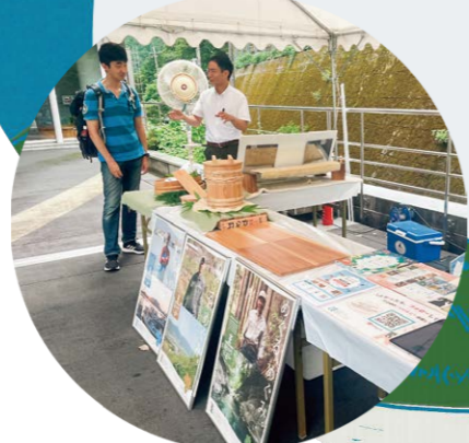
吉野川紀の川の上流・中流・下流をめぐる、めぐみ販売!