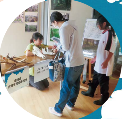
吉野熊野国立公園についての展示・解説もあるよ!