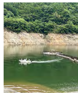
森と水の源流館主催の「夏休みワークショップ大集合」と同時開催した「トヨタソーシャルフェス in 奈良」での巡視船体験のようす

2023年、大滝ダム運用開始10周年の記念式典でのシンポジウムで、子どもたちから出された「おおたき龍神湖」活用のアイデアを少しでも実現に近づけたいとの思いで、巡視船体験の機会に行った「龍神湖カフェ」の社会実験で、飲み物を片手に湖面からの眺