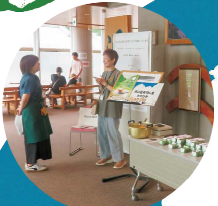
おすすめの柿の葉寿司はありますか?