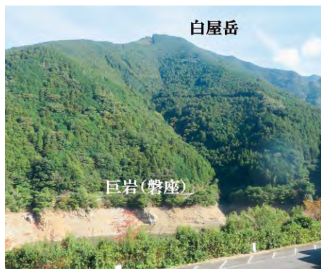
上：当館から見る白屋岳と巨岩（磐座） 下：特別展示した神社関係の品々