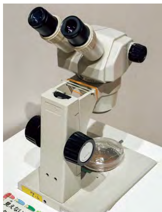
・分解者を顕微鏡で観察してみよう！ ・土壌動物を抽出するツルグレン装置

それぞれの生きものが自身の役割を果たすためには、他の生きものとの連携が不可欠です。生態系つながりの中で、分解者という裏方的な存在であっても、生物多様性を支える大きな役割を持っていることを感じていただければと思います。