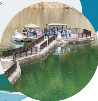
おたき龍神湖の浮棧橋を渡って巡視艇体験ワクワク!