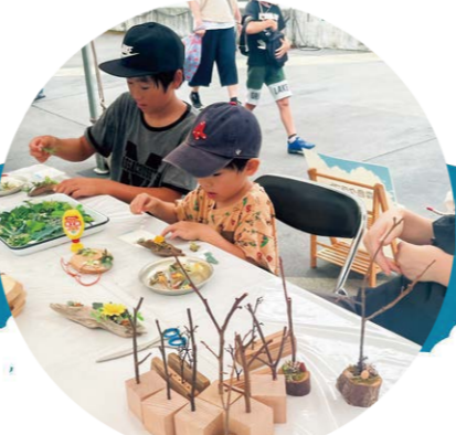
プリザーブドフラワーを使った工作体験!