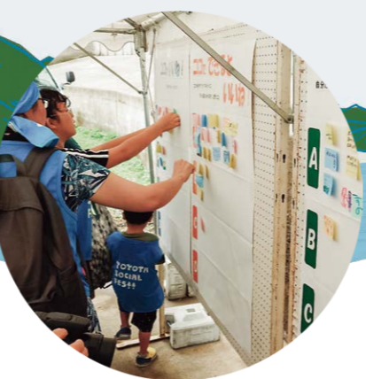
おたき龍神湖の湖面利用についてアイデア募集!

実はこのイベントは私たち職員や出店者同士にとっても地域の課題や取り組みについて情報交換や学びができる貴重な交流の場となっています。