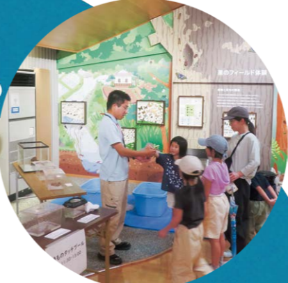
カメやカエルにタッチしたよ!