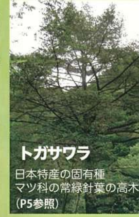
トガサワラ 日本特産の固有種 マツ科の常緑針葉の高木 (P5参照)